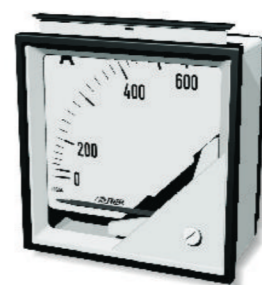
SCALA INTERCambiabile - INTERCHANGEABLE DIAL

* Cod. F14 - scala fissa / not interchangeable scale