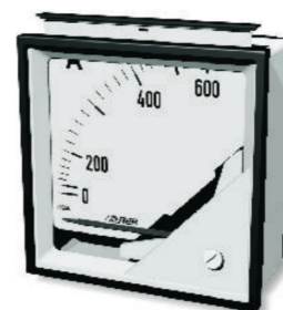
SCALA INTERCambiabile - INTERCHANGEABLE DIAL

* Cod. F14 - scala fissa / not interchangeable scale